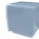
Azul claro Clear blue