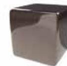
Bronce espejo Mirror bronze