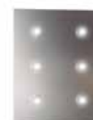
Halógenos LED Spots LED