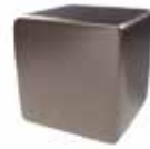
Bronce cepillado Brushed bronze