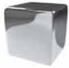
Inox espejo Mirror