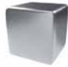
Piel de cerdo Pattern