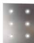
Halógenos LED Spots LED