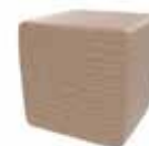
Ivory Oak Cross