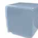
Azul claro Clear blue