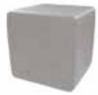
Espiga crema Cream spike