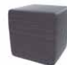
Ebony Oak Cross