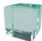
Cristal transparente Clear glass