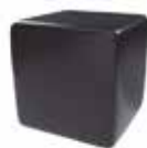
Negro tebas Black tebas