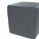
Gris oscuro Dark grey