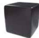
Negro tebas Black tebas