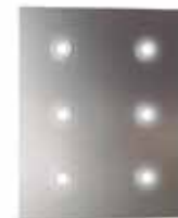
Halógenos LED Spots LED