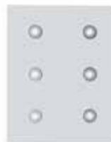
Halógenos LED, pintado White, Spots LED