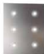
Halógenos LED Spots LED