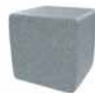
Gris claro Light grey