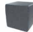
Gris oscuro Dark grey