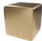
Inox oro cepillado Brushed gold stainless steel