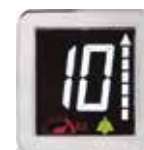
Display rellano LCD negro Black LCD landing display