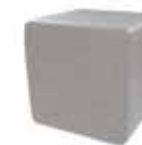
Espiga crema Cream spike