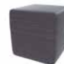
Ebony Oak Cross