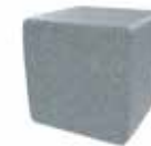
Gris claro Light grey