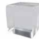
Cristal mate Frosted glass