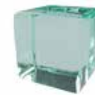
Cristal transparente Clear glass