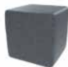
Gris oscuro Dark grey