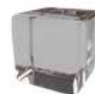
Cristal bronce Bronze glass