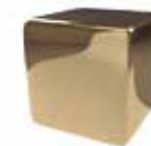
Inox oro espejo Mirror gold stainless steel