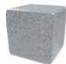
Blanco cristal Crystal white