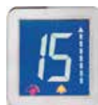
Display rellano LCD azul Blue LCD landing display