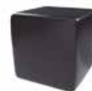
Negro tebas Black tebas