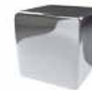
Inox espejo Mirror stainless steel