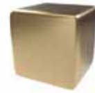
Inox oro cepillado Brushed gold stainless steel