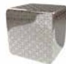
Inox SC431 gold Etched gold stainless steel