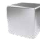
Piel de cerdo Pattern