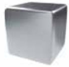
Inox cepillado Brushed