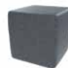
Gris oscuro Dark grey