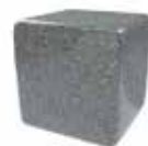
Gris perla Pearl grey