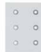
Halógenos LED, pintado White, Spots LED