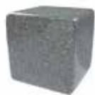
Gris perla Pearl grey