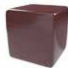
Rojo áfrica Red