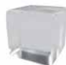
Cristal mate Frosted glass