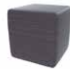
Ebony Oak Cross