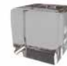
Cristal bronce Bronze glass