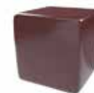
Rojo áfrica Red