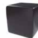
Negro tebas Black tebas